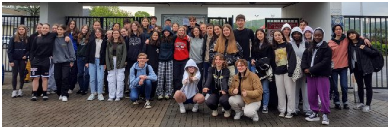
Le départ... :-)