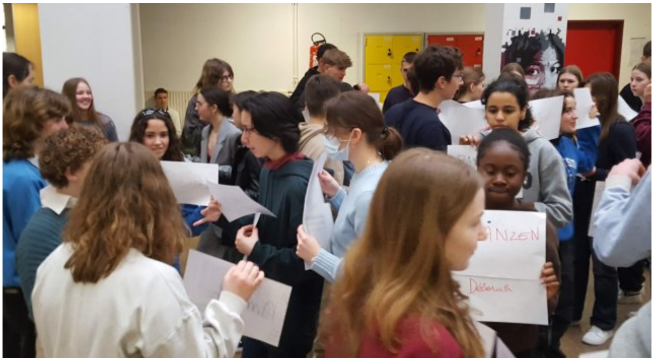
On fait connaissance (à Poitiers)

Le titre du projet " 60 ans d'amitié - le jumelage Poitiers-Marbourg dans le contexte de l'histoire franco-allemande " était programme : en groupes franco-allemands, les élèves ont fait de nombreuses rencontres et interviews avec des acteurs du jumelage et ils ont fait des recherches sur le cadre institutionnel qui unit les deux pays. A partir des résultats de ces recherches, ils ont élaboré un escape game numérique avec de nombreuses énigmes. (publication bientôt)